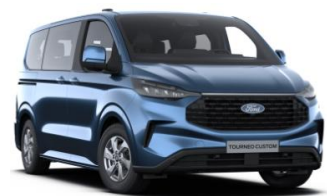
Blue Metallic metalická