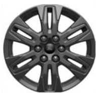
17" Carbonised Grey voliteľne

PRÍSLUŠENSTVO FORD www.ford-prislusenstvo.sk