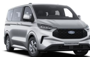
Moondust Silver metalická