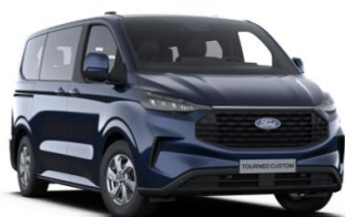
Blazer Blue nemetalická