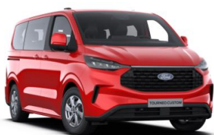
Race Red nemetalická